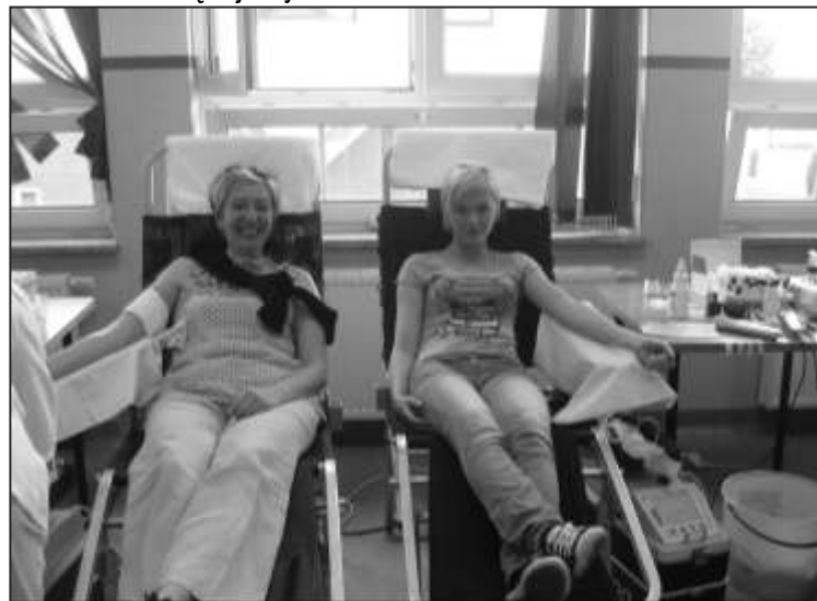
Oddawanie krwi nie boli

kampanii. Tym razem krew oddało 34 osoby, co na warunki wiejskie jest dużym sukcesem. Wszystkim krwiodawcom serdecznie dziękujemy.