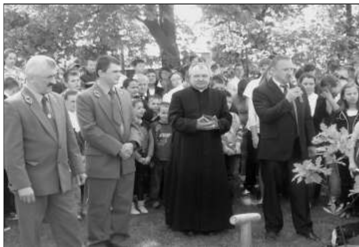
Sadzenie dębu Karol