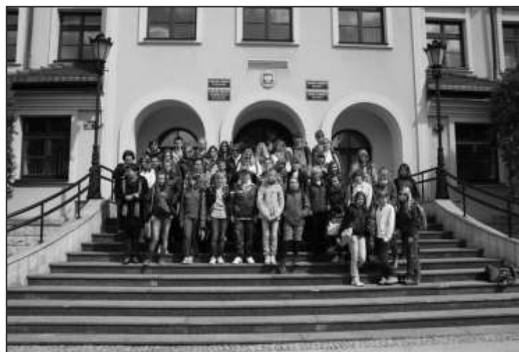
Po spotkaniu w ratuszu

W dniach 4-6.05.2011 gościliśmy w Rudnej 23 uczniów i trzech opiekunów z Zakładni Skoly w Rudnej k. Pragi. Uczniowie w ciągu trzech dni przebywali w polskich domach u uczniów Zespołu Szkół im. Jana Pawła II w Rudnej.