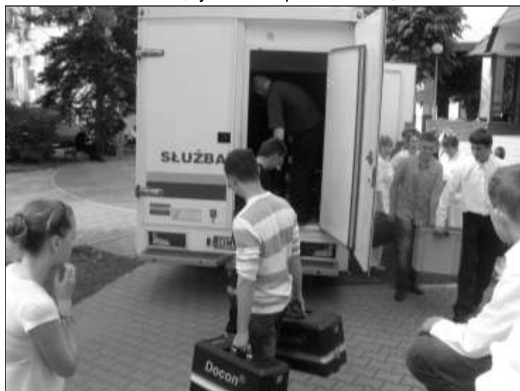
Przygotowania do akcji oddawania krwi

Tego samego dnia w budynku gimnazjum została zorganizowana akcja krwiodawstwa, która trwała od godziny 12 do 16. To kolejna akcja zorganizowana przez szkołę w Rudnej przy współpracy z oddziałem krwiodawstwa w Lubinie i Wrocławiu, tym razem pod hasłem „I am Krewki”.