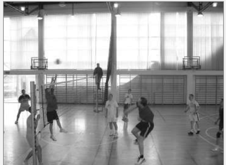
Mecz Chobienia - Nieszczyce

Szczegółowe wyniki spotkań publikowane są na www.ckwr.eu oraz www.siatkowka-rudna.prv.pl . Zapraszamy też na forum www.gminnasiatka.fora.pl gdzie można komentować rozegrane mecze, zapoznać się z wynikami ubiegłego sezonu i wiele innych.