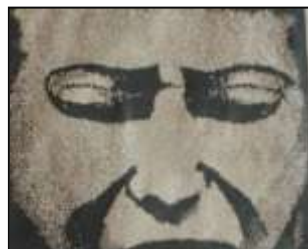
Linoryty Beaty Pleban