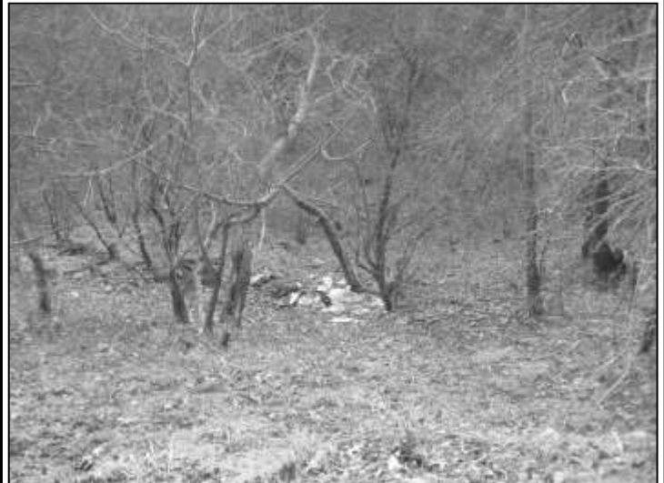
Fot. Wyrzucone śmieci w jarze między Chobienią a Radoszycami.

W ubiegłym roku uporządkowanych zostało 17 takich miejsc, na co zostało wydane prawie 130 tys. zł. Postawione zostały również tablice informujące o zakazie wyrzucania odpadów. Nie wszyscy jednak stosują się do tych zakazów, i wolą mieszkać wokół „zaśmieconych” miejsc!